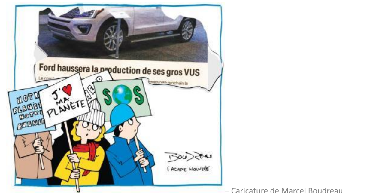
– Caricature de Marcel Boudreau