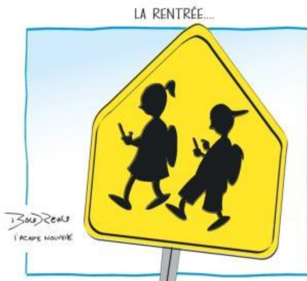
– Caricature de Marcel Boudreau

À l’occasion de la rentrée des classes, la caricature porte un regard taquin sur la jeunesse de 2019.