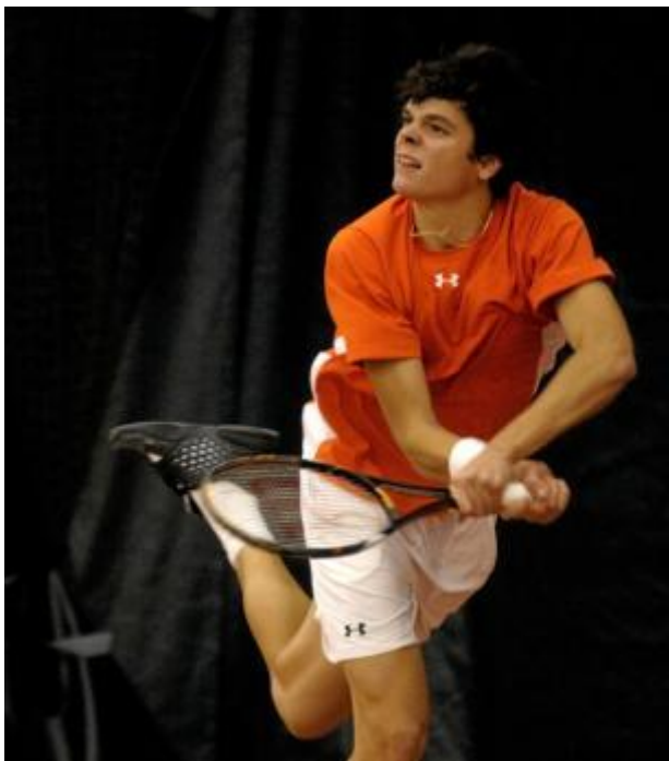
Milos Raonic 24 novembre 2011

L'équipe de hockey junior de Sherbrooke est officiellement baptisée le Phoenix. Le premier match de la nouvelle formation à Sherbrooke se tient le 21 septembre 2012. Les joueurs vedettes de