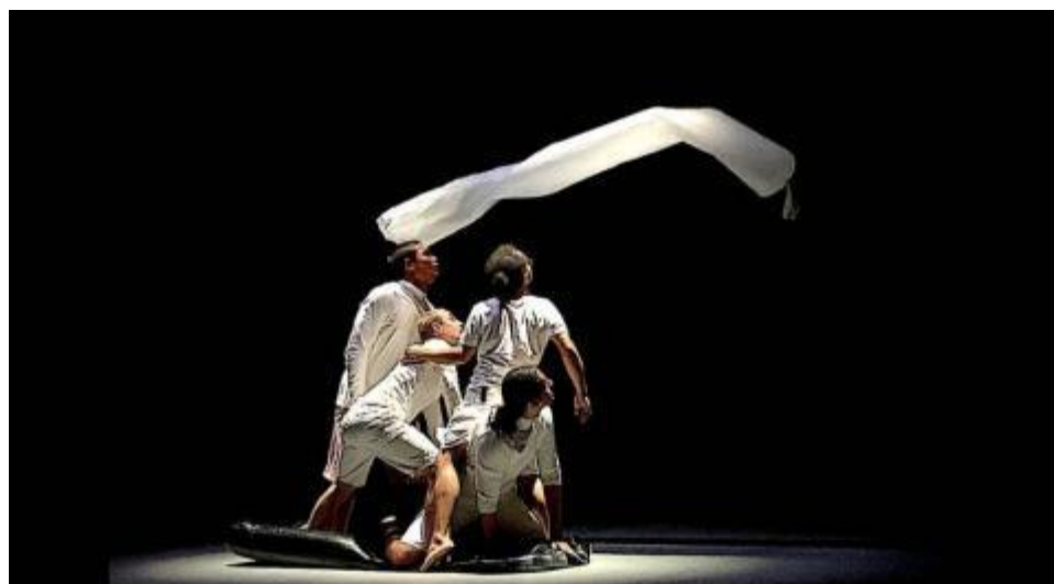
Gonfle se donne encore ce soir au Séchoir, 20h.