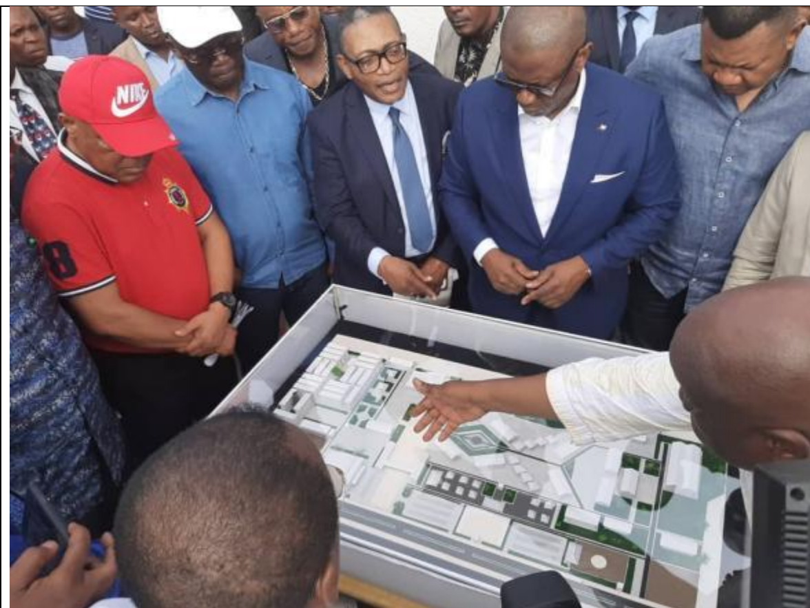
Les jours s'égrènent et les travaux tardent à commencer pour les travaux de construction du village des jeux et autres édifices prévus pour les jeux.