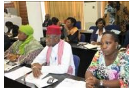
Voir la photo - 20 octobre 2014