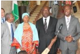
Voir la photo - 20 octobre 2014