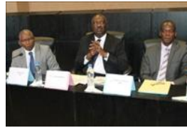
Voir la photo - 20 octobre 2014