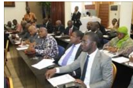
Voir la photo - 20 octobre 2014