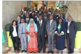
Voir la photo - 20 octobre 2014