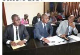
Voir la photo - 20 octobre 2014