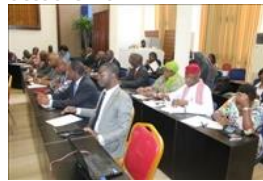
Voir la photo - 20 octobre 2014