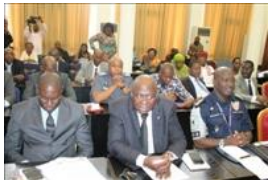
Voir la photo - 20 octobre 2014