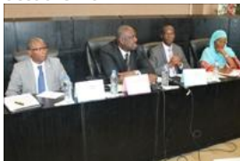
Voir la photo - 20 octobre 2014