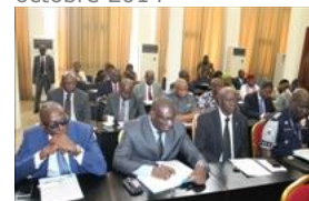
Voir la photo - 20 octobre 2014