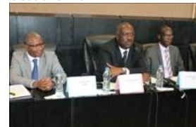
Voir la photo - 20 octobre 2014