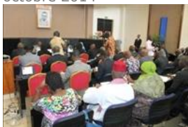
Voir la photo - 20 octobre 2014