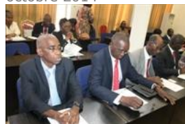
Voir la photo - 20 octobre 2014