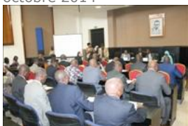
Voir la photo - 20 octobre 2014