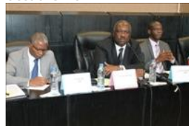
Voir la photo - 20 octobre 2014