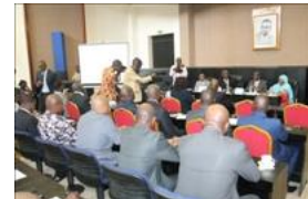
Voir la photo - 20 octobre 2014