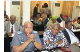
Voir la photo - 20 octobre 2014