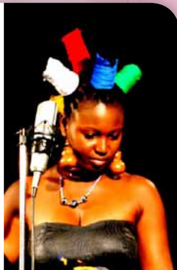
Loyle Mamba

31 mai 2013: Confirmation par les États et les gouvernements de l'engagement définitif et nominatif de leur délégation dans les épreuves où ils auront des concurrents. Aucune modification nominative ne sera acceptée après cette date.