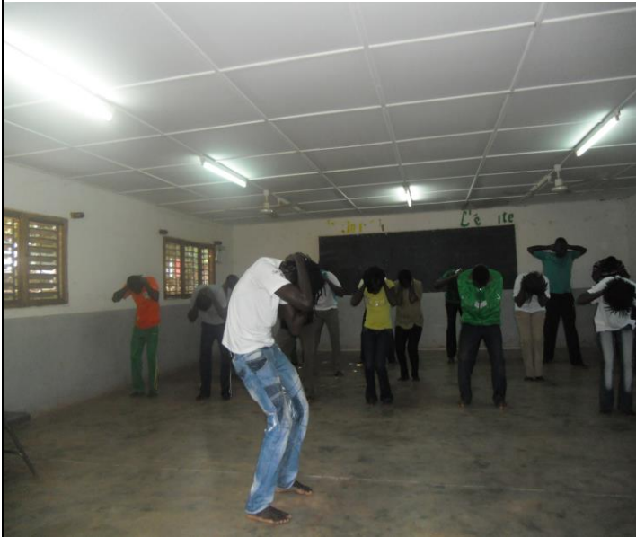
Donnant un atelier de danse aux enseignants d'école primaire de la région de Hauts Bassins dans le cadre de leur formation.