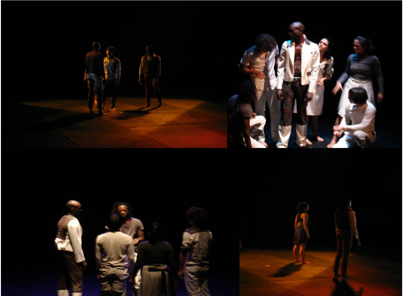
Colours color et The Hopeless penguin, deux pièces respectivement de 5 et 7 danseurs venant de l'Inde, le Congo, la Malaisie, la Corée du sud et le Burkina, créées à l'occasion de la résidence de C.P.I (Cultural Partnership Initiative) sous la commande de SIDance Festival et sous la direction du Ministère Sud-coréen de la culture et du tourisme.