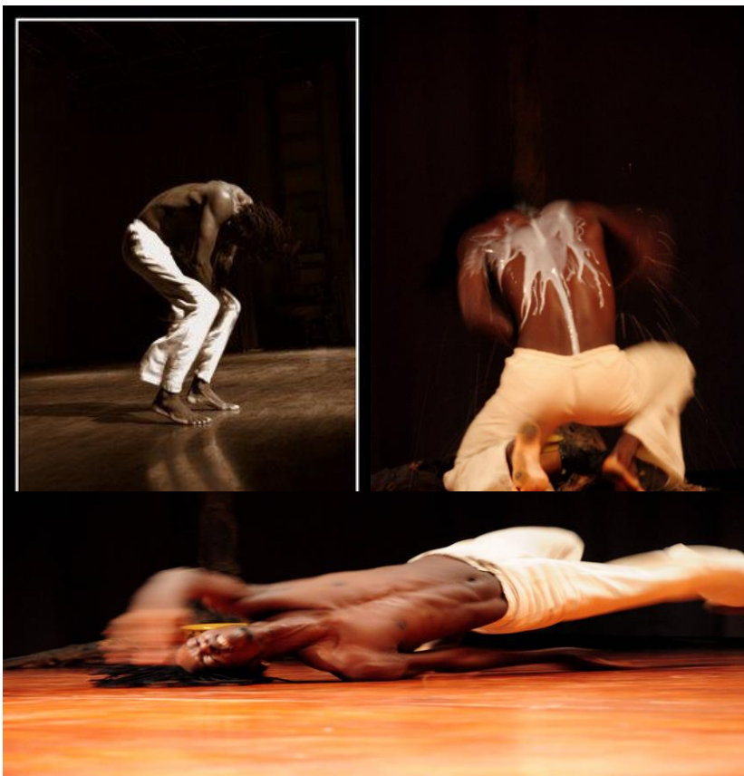
Laada, est solo, un cocktail de conte, de danse et de musique pour tout public créé et joué en Afrique (Burkina Faso, Maroc, Mali...)