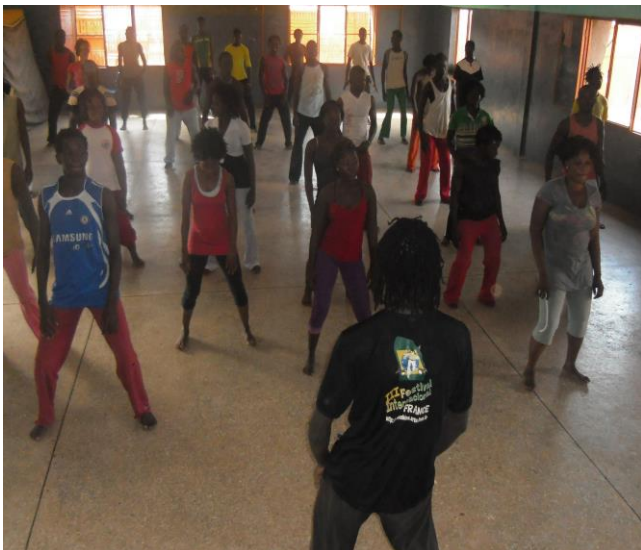
Stage de danses africaines et contemporaine Bobo Dioulasso – Burkina Faso