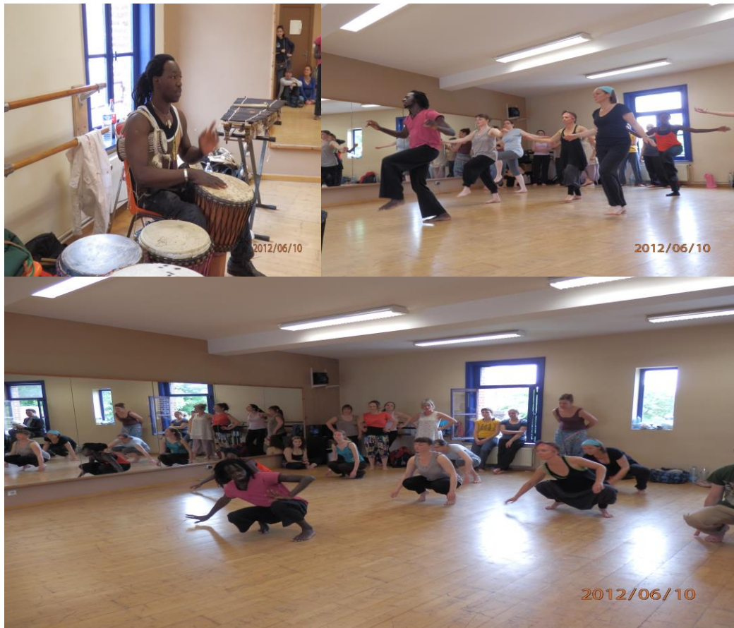
Stage de danse au festival Tamadi'art Nord de pas de calais, Carvin - France