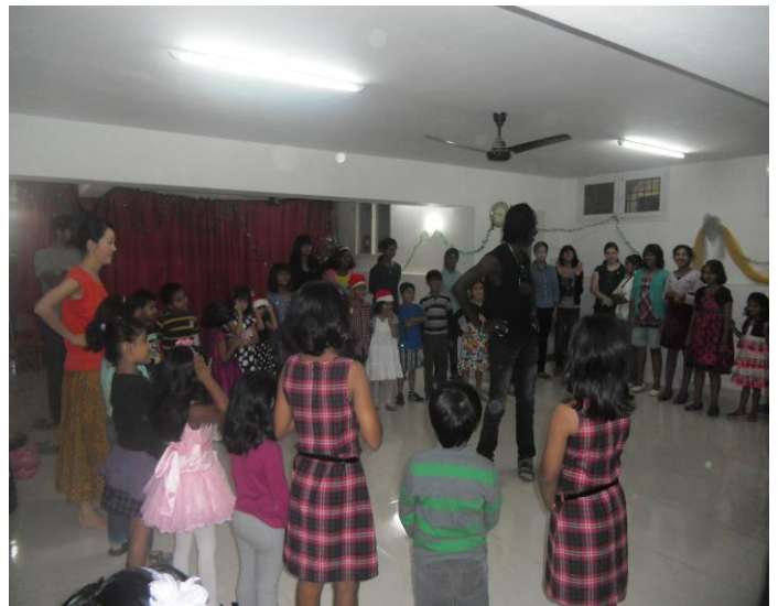
Apprentissage de chants africains par les élèves d'une école de musique Bangalore - Inde